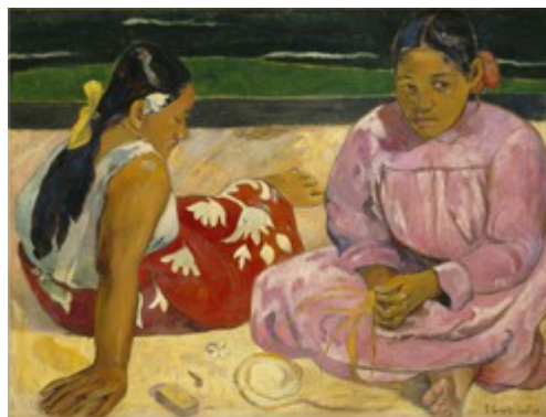
Paul Gauguin Femmes de Tahiti ou Sur la plage , 1891 (detalle) [Mujeres de Tahití o En la playa] Óleo sobre lienzo Musée d'Orsay, París Donación de la condesa Vitali en memoria de su hermano el vizconde Guy de Cholet, 1923 RF 2765