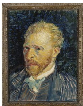
Autoretrat de Vincent Van Gogh

El triomf del color estarà oberta fins al 10 de gener i la Fundació preveu que la visitin 150.000 persones. Primer es podrà veure a Barcelona i després a Madrid.