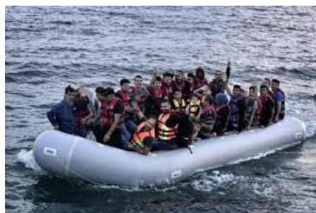
Refugiats arribant al seu destí

Cada dia arriben a les illes gregues embarcacions, molt fràgils, algunes de les quals naufraguen, produint-se terribles situacions. La Unió Europea liderada per la Cancellera alemanya Àngela Merkel ha fet diferents reunions per decidir com participar i dividir-se els refugiats els diferents països de la UE. Però molts països han estat reticents a acceptar refugiats, i els acords han estat, fins ara, mínims. Alemanya ha estat el país més sensible a aquest tema i més acollidor. Hi ha la necessitat de coordinar i acollir aquestes persones, però manca encara la voluntat de fer-ho. És un repte per la Unió Europea demostrar una cara més solidària i una major coordinació i acord.