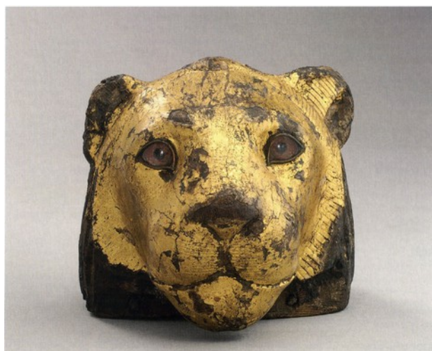
Element d'un moble en forma de cap de lleó

en aquest món, i és aquest el tema que tracta l'exposició, tant en l'àmbit pràctic com en el món de l'espiritualitat i del poder.