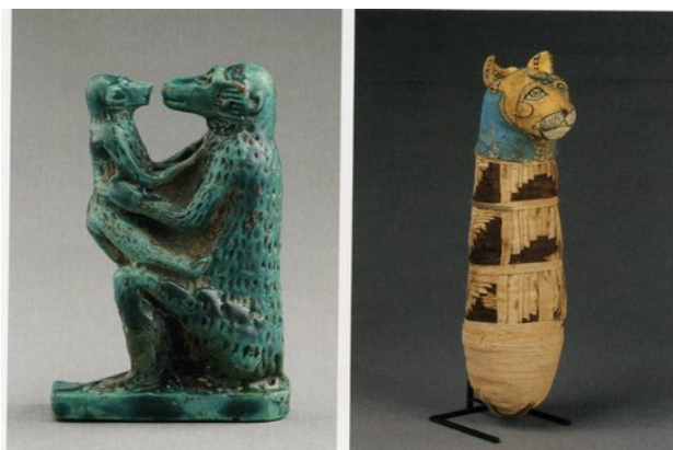
Figureta de mare mona amb la seva cria

La complexa i sofisticada cultura de l'Antic Egipte, que es va desenvolupar des de fa més de 5000 anys, va crear una rica cosmogonia que va expressar artísticament de manera sublim a través de les nombroses manifestacions artístiques que va produir. Els animals tenen una relevància important