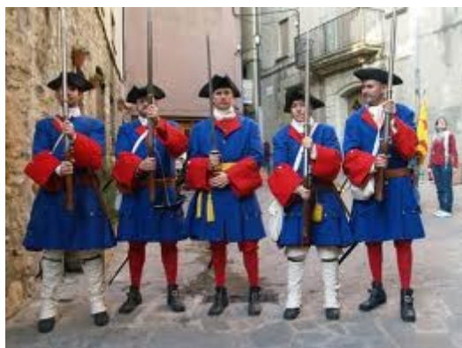
Miquelets amb l'uniforme

Els Miquelets o Micalets eren els membres de la milícia de caràcter mercenari o voluntari, reclutada per les diputacions i juntes de la Corona d'Aragó, per a accions especials o com a reforç de les forces regulars.