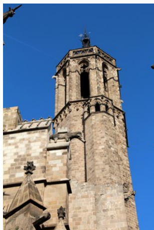
D'aquí van baixar la campana Honorata

Començarem la passejada a la Catedral de Barcelona. En una primera parada ens fixarem amb el campanar de la Catedral on hi havia estat la campana Honorata , que va ser fosa a la fi de la guerra juntament amb les altres campanes de la ciutat.