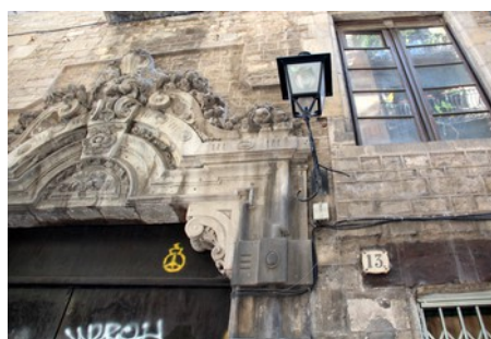
Palau Vilana Perles

Seguirem pels carrerons estrets del barri gòtic on veurem el Palau Vilana Perles on en Felip V va redactar el Decret de Nova Planta .