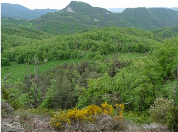
Imatge des de l'inici de la pujada a la Serralada dels Bufadors

Avui us mostrarem algunes imatges d'un paratge màgic: Els Bufadors , dins de la serralada del mateix nom, al Cabrerès.