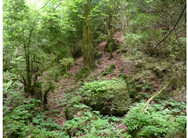
Algunes imatges que mostren aquest indret tant espectacular..

El paratge dels Bufadors és màgic, un petit i ric ecosistema dins de la serralada, amb una vegetació esplendorosa, desenvolupada amb unes condicions d'humitat i temperatura especials. Faijos alts i frondosos, molses cobrint les branques i les pedres, falgueres espectaculars..., un regal pels sentits.