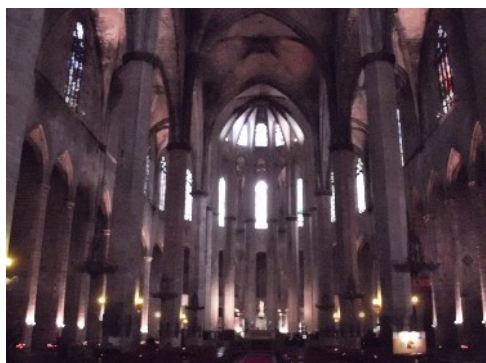
Interior de Santa Maria del Mar

El segon destí va ser Santa Maria del Mar , exemple destacat de l'arquitectura gòtica catalana. Vam poder contemplar aquest magnífic edifici, tant per fora com per dins. L'interior és majestuós i es percep una unitat en l'espai degut a la seva estructura: planta de saló i naus de gairebé la