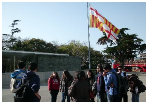
Davant del Pavelló Alemany

Un cop acabada la visita guiada al MNAC, vam dinar, i, a continuació, vam visitar El Pavelló Alemany , del genial l'arquitecte Mies Van der Rohe, construït per a L'Exposició Universal de 1928 , en pur estil racionalista.