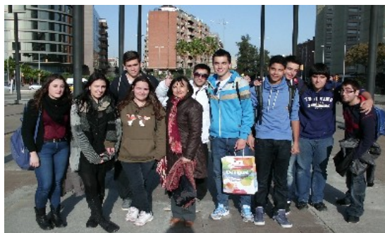
En el trajecte cap a l'estació de Sants

Vam gaudir de l'harmonia i lluminositat de l'edifici i després de valorar-lo en el seu conjunt, vam passar per Caixa Fòrum, per dirigir-nos ja a l'estació de tren de Sants.