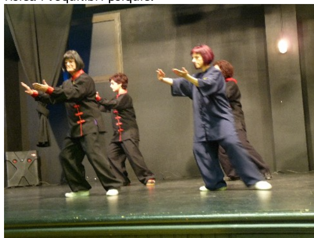
Demostració per part d' alumnes d'alguns moviments.

Seguidament, la part més àmplia, hi ha les explicacions referents a la part pràctica del Tai-txí des de l'escalfament, la posició del cos, els moviments, la relaxació..., tot il·lustrat amb imatges, per tal de dur a terme una pràctica correcta amb efectes estimulants sobre l'organisme, amb l'objectiu de potenciar la salut física i l'equilibri psíquic.