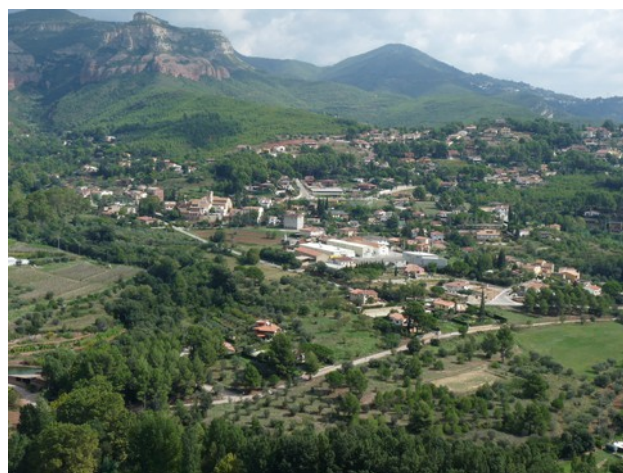
L'entorn de Riells del Fai

Vam poder observar el començament de la Vall del Tenes, les poblacions de Riells, Bigues, Santa Eulàlia de Ronçana, Granollers i, al fons, la Serralada Litoral, i el mar en la llunyania. També la visió de les Cingleres va ser magnífica: el Clascar, el Traver, el Turó de les Onze Hores, les Costes d'en Batlles..., el Puiggraciós i, més llunyà, El Turó de l'Home.