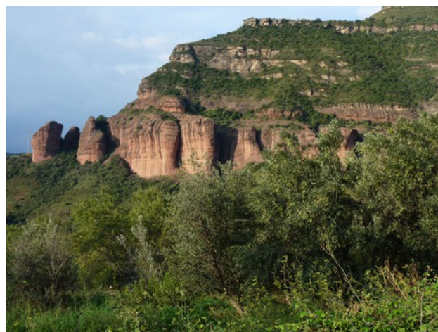
La gamma cromàtica de les Cingleres

El terreny estava intensificat en colors i olors per les pluges del dia anterior i l'ambient era molt agradable.