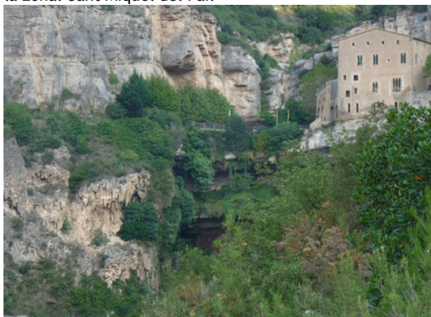
Sant Miquel del Fai

El dia 6 d'octubre va ser la XXXIII Marxa Passeig que, com és tradició, va sortir de la plaça de Riells del Fai, per fer un interessant recorregut per les Cingles del Perer, passant primer per un dels indrets més emblemàtics de la zona: Sant Miquel del Fai.