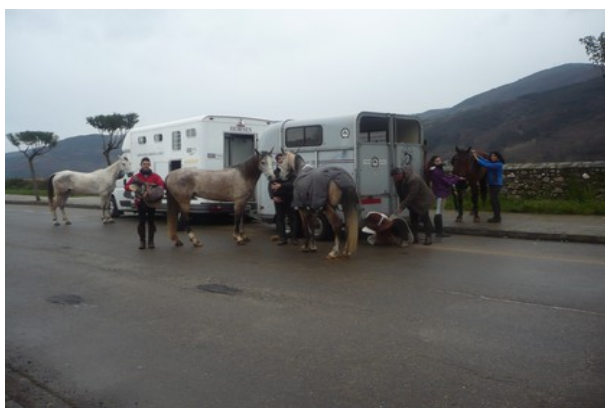
Els cavalls a punt per iniciar el camí.

Nosaltres vam triar el camí francès un total de 760 Km des de Roncesvalles (Navarra) a Santiago. Concretament vam iniciar el nostre camí a cavall a Vilafranca del Bierzo (León) i el vam acabar a Santiago, un total de 120 Km.