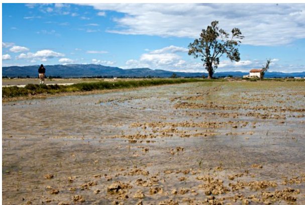
Camps d'arròs inundats

La Xarxa Mundial de Reserves de la Biosfera forma part del Programa 'L'Home i la Biosfera' (MAB) de la UNESCO, composta actualment per 610 reserves disseminades per 117 països. La inclusió de noves reserves la decideix la Mesa del Consell Internacional de Coordinació del Programa sobre l'Home i la Biosfera (MAB), amb seu a París. A l'estat espanyol hi ha 40 espais que són reserva mundial de la biosfera, només un a Catalunya, el Parc Natural del Montseny, des del 1978. Les Terres de l'Ebre són la segona reserva catalana que aconsegueix aquesta declaració, 35 anys després de la primera.