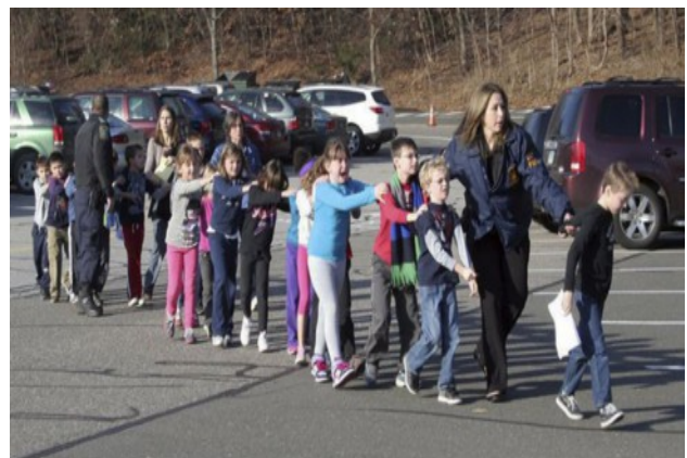
Fotografia dels nens de Newtown