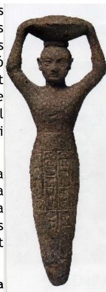
Figura fundacional d'Ur-Namma 2112-2095 aC.

Animem doncs a tothom, a visitar i gaudir d'aquesta exquisida exposició, i a descobrir en les bells documents que ens ha llegat, una part remarcable de la nostra cultura.