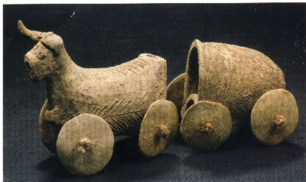
Toro sobre rodes i carro envelopat, III mil·lenni aC.

Aquesta exposició tracta dels inicis de la civilització a l'antiga Mesopotàmia, zona geogràfica situada a l'actual Iraq, al voltant dels rius Tigris i Èufrates. Actualment, aquest país devastat per la invasió americana, va ser, antigament, a partir del quart mil·lenni adC, un dels focus de civilització més importants i antics del món.