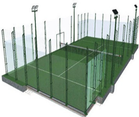
Pista de pàdel

Es desenvolupa en una pista rectangular de 10 metres d'amplada per 20 de llargada dividida transversalment per una xarxa i envoltada per parets en el fons i en els extrems dels laterals i una reixa metàl·lica al llarg de tot el perímetre.