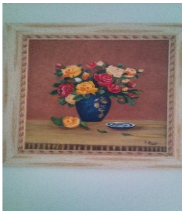
Alguns dels seus quadres

·Has guanyat algun premi pintant? Sí, al casal on pinto em van donar un premi a la Festa Majors del barri, però el que m'importa no són els premis. La veritat és que m'agrada molt pintar i m'ho passo molt bé.