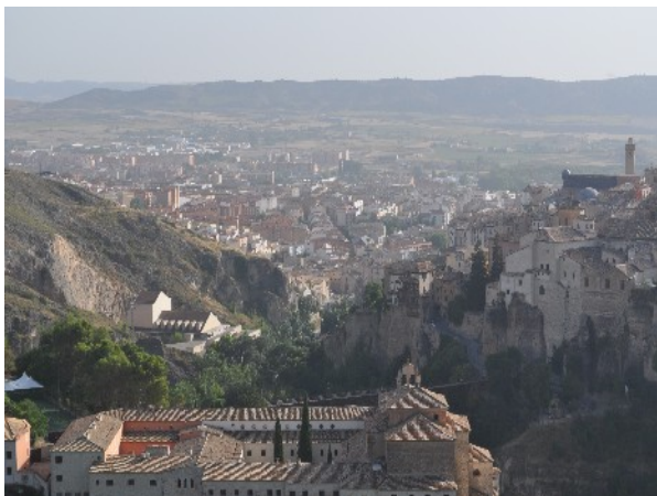
Cases penjades de Conca

Els llocs que he anat a visitar són "les cases penjades", però no us creieu que estan penjades d'un fil, sinó que es troben penjades d'un penya-segat.