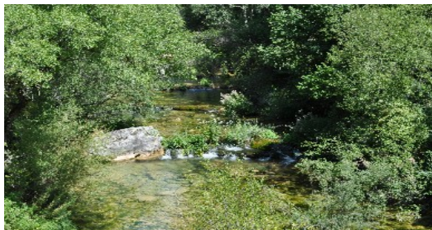
Naixement del riu Cuervo

Una altra visita que vam fer va ser anar al naixement del riu Cuervo , al seu costat hi havia la fàbrica d'aigua Solan de Cabras , és enorme i hi treballa molta gent. Al costat hi trobem un balneari molt tranquil.