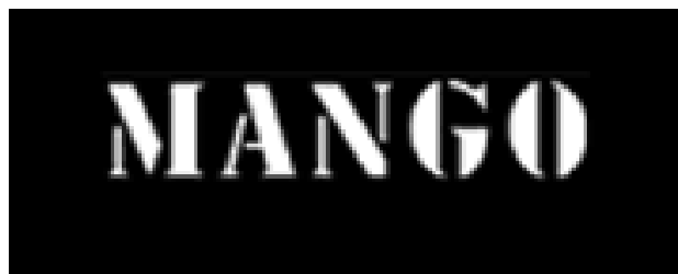
Logòtip de Mango

El 8 d'Octubre de 2008 es va inaugurar la primera botiga per a home de Mango, que s'anomena "HE BY MANGO."