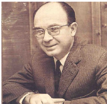
Vicent Andrés i Estellés

Aquest fragment parla sobre el record en la travessia d'aquests temps en el qual varen sofrir molt perquè no només faltava la llibertat d'expressió i de drets, sinó també perquè el mateix fet d'haver d'abandonar la seva terra va ser un tram molt difícil de pair. Podem prendre consciència d'aquesta experiència traumàtica si per un moment haguéssim d'imaginar el fet d'haver d'abandonar-ho tot, les nostres cases i altres objectes de la nostra vida per anar a un altre país, en el qual no sabem si serà millor o pitjor i tot per poder viure en un estat de vida amb un mínim de normalitat.