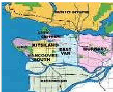
Mapa de Vancouver

Els XXI Jocs Olímpics d'Hivern s'han realitzat a la ciutat de Vancouver, Colúmbia Britànica, Canadà, entre el 12 i el 28 de febrer del 2010.