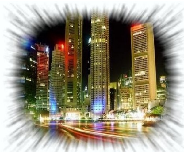
Aspecte nocturn de Singapur

Pel que fa a la seguretat, tot el circuit estarà completament il·luminat durant la cursa perquè es garanteixi plenament la integritat, tant la dels pilots com la dels espectadors.