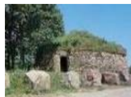
Pou de glaç de Can Gurri Lliçà de Vall.

I aquí acaba la nostra notícia dels pous de glaç de Lliçà de Vall i us recomano que hi aneu perquè us sorprendrà molt veure-ho al natural.