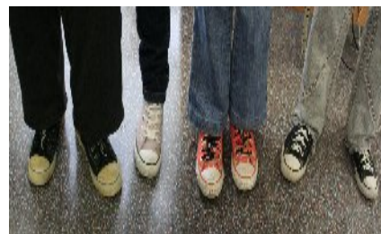
Les nostres "converse", molt diferents entre sí.

Les Converse són molt personalitzables i n'hi ha de tota mena.