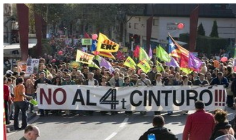
Manifestació contra el Quart cinturó

Encara que segons el nou president de la Generalitat, Jose Montilla, alguna part del traçat podria canviar, encara que no hi ha res de concret.