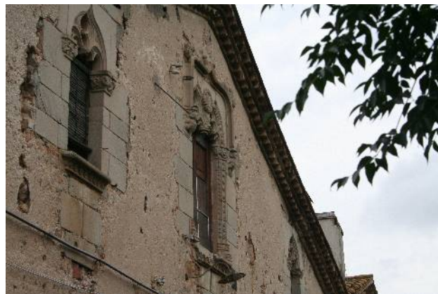
Façana principal de Can Moncau

Can Moncau fa 90 (ha) i està qualificada com a zona industrial. Actualment, la propietària de la zona és l'empresa MANGO que hi pretén construir la seva àrea industrial.