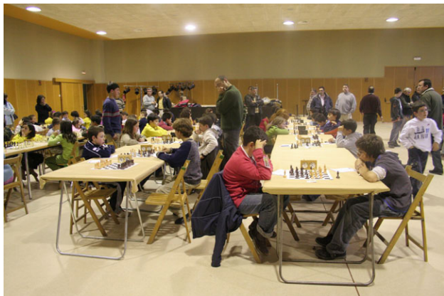
Jocs escolars a la fàbrica de Santa Eulàlia de Ronçana amb la participació del club d'escacs de Lliçà d'Amunt

El club d'escacs amb seu a Lliçà d'Amunt es va fundar a l'octubre de 2001.