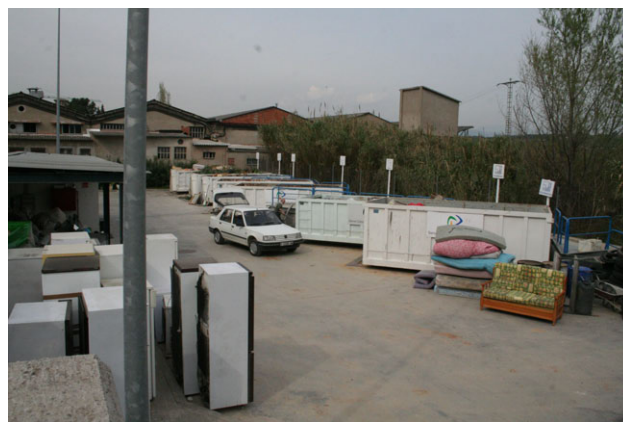
Deixalleria de Lliçà d'Amunt