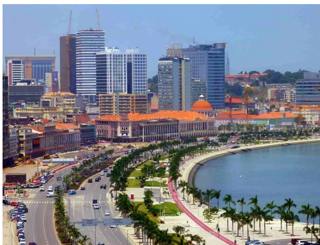
La capital del país, Luanda.

Us posaré d'exemple el país on vaig néixer: Angola. Us parlaré de política, de la gent, de la situació econòmica, de la mentalitat i de la cultura del país. Finalment, us explicaré la meva experiència com a persona d'arrels africanes.