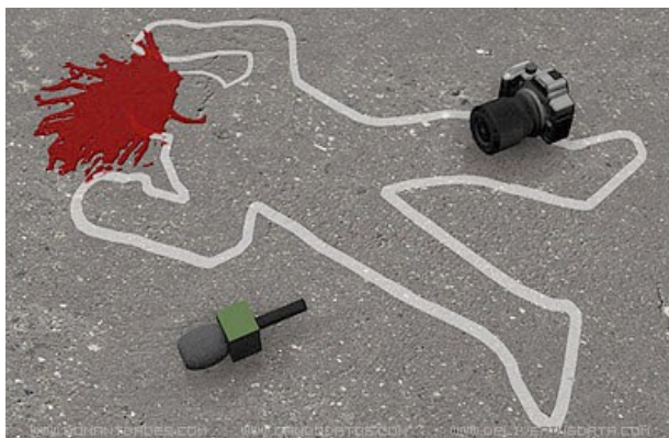
(representació simbòlica de periodistes assassinats)

Moltes de les seves publicacions es basen en informes obtinguts mitjançant la xarxa IFEX. Tenen el suport de de corresponents de premsa en nombrosos països del món, que no estan exposats a les mateixes pressions que, a vegades, pateixen els periodistes locals. RSF considera que la seva independència està garantida gràcies al fet que poden fer públics les seves pròpies anàlisis amb independència de les pressions que puguin sofrir els representants del RSF o de l'IFEX en un país en concret.