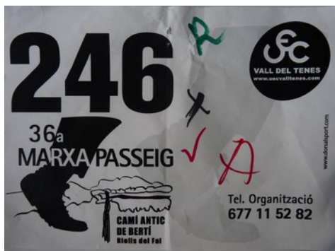
Dorsal de la marxa

Com cada any, a l'octubre, des de fa 36 anys, es realitza la passejada per les Cingleres de Bertí, organitzada per La UEC de la Vall del Tenes.