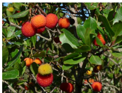
Cireretes de pastor, els fruit de l'arboç