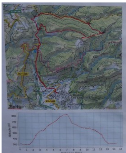
Mapa topogràfic amb la ruta i desnivell

La sortida, enguany es va realitzar el diumenge dia 8, entre les 8:00 i les 9:00 del matí des del Centre Cívic de Riells del Fai, amb un recorregut de 14,5 Km., amb 650 m. de desnivell positiu.