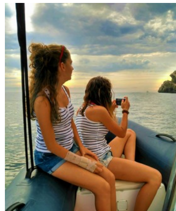
Admirant el paisatge

Els meus pares van decidir de llogar una petita barca al port de l'Escala. Vam estar dues hores a la barca passant-ho bé. Durant aquesta estona, una de les vegades, vaig conduir la barca. Vaig passar per sota d'una cova impressionant, on l'aigua era transparent i es podia veure els peixos i els éssers vius que habitaven aquella magnífica part de la cova sota l'aigua.