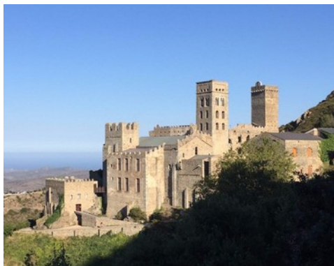
Monestir de Sant Pere de Rodes

El monestir de Sant Pere de Rodes va ser construït durant els segles X i XI i és una mostra excepcional de la cultura romànica. Encara que el monestir va ser construït deu segles abans, les restauracions que hi han dut a terme fan d'aquest indret un monument privilegiat.