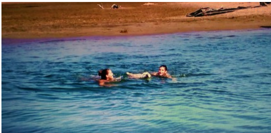
Desembocadura del Fluvià a Sant Pere Pescador

Sant Pere Pescador és una petita població del Baix Empordà on la gent hi va per descansar amb la seva família, o bé per passar un bon dia a la platja, o per allotjar-se en un càmping o llogar un petit apartament per passar-hi les vacances, aquest poble és un lloc relaxant i bonic.