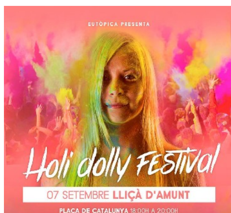
Cartell informatiu d'una de les activitats

El 7 de setembre va haver un Holly dolly festival a la plaça Catalunya de 18:00h a 20:00h de la tarda. I Tota la gent que hi va participar, va sortir-ne empolsinada de diferents colors.