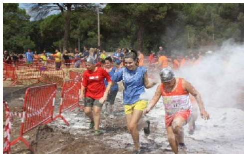
Imatge de la competició entre colles

Les proves són sempre secretes fins al moment de dur-les a terme.