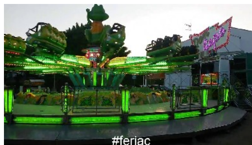
Aspecte de la fira d'atraccions

Del 8 al 11 de setembre la població va gaudir de les atraccions de la fira amb la família, passant-ho bé, amb els petits de la família i pujant als cavallets... mentre que els adolescents baixaven al poble amb els seus amics per divertir-se en "el sapo" i altres atraccions més agosarades.