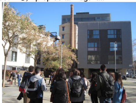
Plaça, habitatges i oficines amb el record de la indústria

A partir de llavors continua la transformació de la ciutat, noves activitats econòmiques, equipaments, habitatges i projectes. La millora de la ciutat ha estat espectacular, l'augment dels equipaments, la cura dels aspectes estètics, la instal·lació d'espais de creativitat i de noves activitats. Tot i això cal remarcar també que amb la millora també s'ha incrementat l'especulació, denunciada pels moviments veïnals. L'arribada del fenomen del turisme, que està implicant la construcció de nombrosos hotels, especialment a la zona del 22@, i prop de la Diagonal.