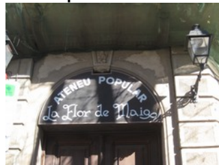
La Flor de Maig

ciutat a polígons industrials. Cal destacar l'activitat associativa i reivindicativa que es va desenvolupar paral·lelament a la industrialització. Destacar en aquest àmbit la Cooperativa Flor de Maig .