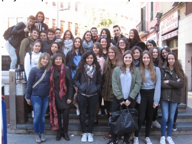
Iniciem el trajecte al metro de Poblenou

El dia 7 de març de 2017, es va realitzar la sortida de Geografia de 2n de Batxillerat a Poblenou, barri de la ciutat de Barcelona, molt interessant per estudiar les ràpides transformacions que ha experimentat aquesta zona de la ciutat, i els projectes que en el futur es volen portar a terme.