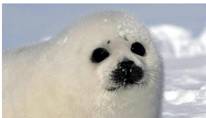
Cria de foca arpa

La caça de foques en Canadà i Groenlàndia és una activitat constant en l'obtenció de recursos a partir de, principalment, les cries de foques arpa.