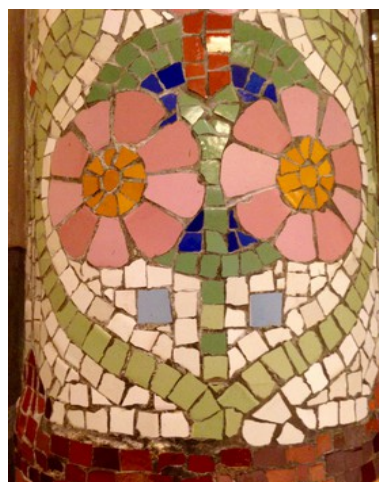
Trencadís d'una columna del Palau de la Música

L'experiència ha estat molt enriquidora per les famílies i per als alumnes. Han descobert qui els