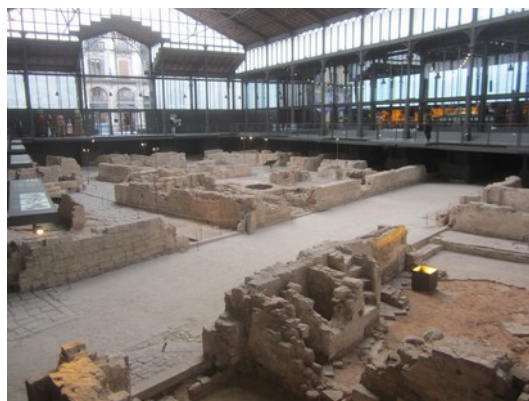
Ruïnes del barri la Ribera al Born

acollirà a principis d'abril a la Bretanya, i s'han conegut millor. Us deixem algunes fotografies que expliquen sense paraules com ha transcorregut aquesta setmana plena d'il·lusions.