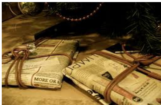
Regals embolicats amb paper de diari

També si voleu fer una decoració bonica i original, podeu utilitzar llibres vells, objectes que tenim a casa , ... i així podreu realitzar decoracions molt maques com les següents: