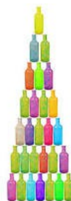
Avet amb ampolles