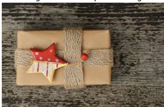
Envoltori amb paper d'embalar

En època de crisi, no cal comprar papers cars per presentar els nostres regals de Nadal d'una forma original i bonica, podem reciclar el paper de diari i embolicar regals o bé fer petits detalls embolicats de forma original com la d'aquestes imatges: