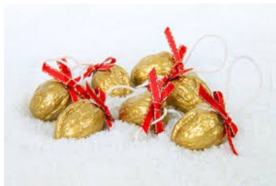
Nous amb purpurina

Per nadal també s'agafen branques d'arbres, molsa, boix grèvol o avets... que malmeten els boscos. Això ho podem parer d'una manera creativa.