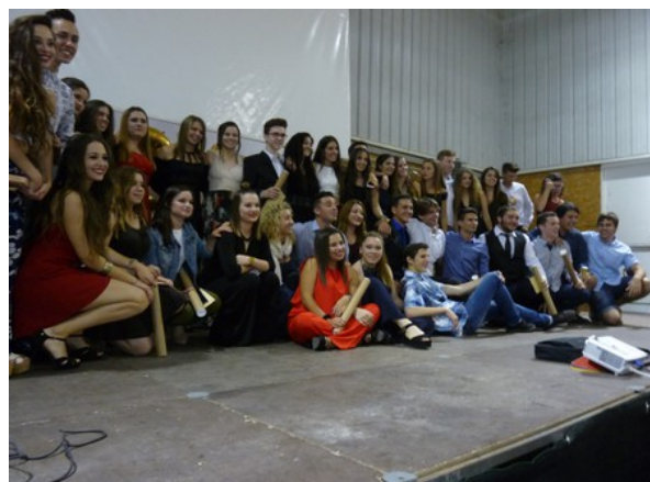
Imatge de grup de l'alumnat de 2n de Batxillerat

Cal dir que l'alumnat es prepara molt acuradament per aquesta festa cuidant molt els aspectes estètics: vestits i pentinats molt sofisticats, harmonia cromàtica i elegància.