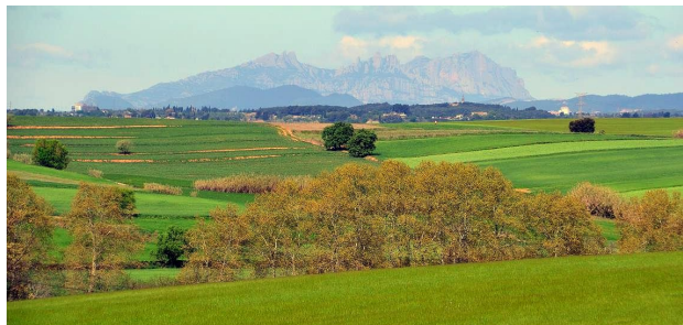
Gallecs, Parets del Vallès

Aquí us deixo una foto del paisatge que es veu quan esteu allà: