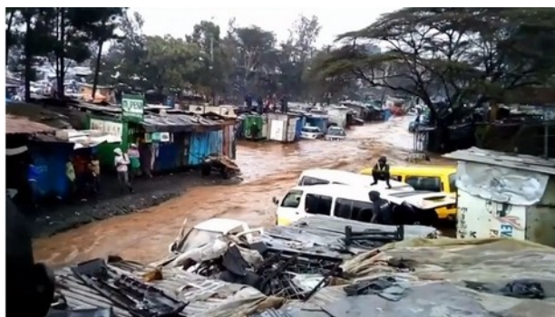
Insumofunlarne a Mbatoni (Daurhara)

Pluges torrencials a Kènia , han provocat diversos morts a zones rurals i nuclis urbans.