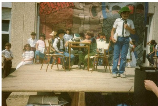
El presentador és el nostre professor incògnita

El que li agrada més fer en el seu temps lliure és fer esports i anar a veure pel·lícules al cinema, doncs és un gran cinèfil. Destaquem una anècdota en relació a l'esport: és que un dia quan anava passejant amb bicicleta va caure i es va trencar el nas.