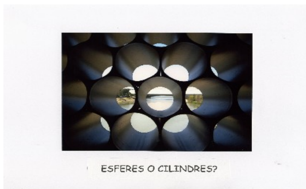
Esferes o Cilindres d'Emili Batxiller