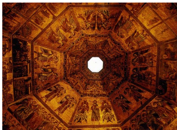
Octàgon Celestial de Beatiz de la Casa