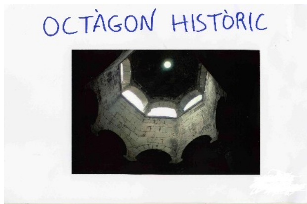
Octàgon històric de Ginesta Pesas 2n C