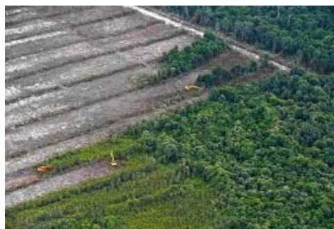
Desforestació d'una selva a Borneo

L'estudi, encapçalat per investigadors de l'Institut Max Planck per a Estudis de l'Antropologia Evolutiva, a Leipzig (Alemanya), i de la Universitat John Moores de Liverpool, al Regne Unit, conclou que la població estimada per al 1999 ha resultat ser molt més gran del que es pensava, però també el nombre de baixes produïdes des d'aleshores