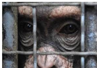
Orangutan en un mercat il·legal de tràfic d'aquests animals

L'estudi, el més detallat fins ara sobre l'espècie, mostra que el descens ha sigut comú a tot el territori de Borneo on queden orangutans. I el futur no és gens favorable. Els mateixos investigadors han calculat que 45.000 exemplars més es perdran els pròxims 35 anys si prossegueix l'actual retrocés. Per ara, els més amenaçats són els aproximadament 10.000 orangutans que habiten en zones forestals pròximes a les plantacions d'oli de palma.