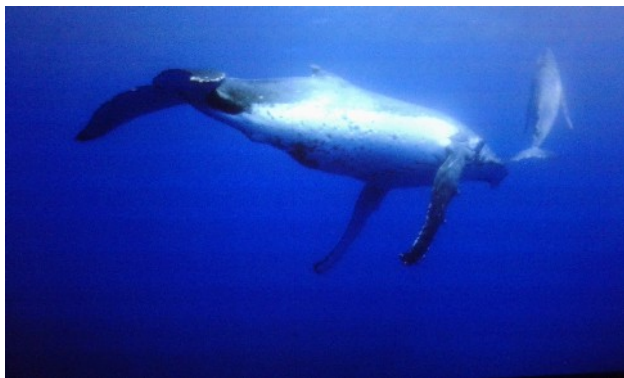
Imatge d'una balena i el seu fill

En grans pantalles d'alta definició se'ns mostren éssers amb formes i colors exuberants que poblen aquests ecosistemes, en una, on apareixen les balenes , podem també escoltar els sons amb els que es comuniquen aquests éssers, els més grans del Planeta.