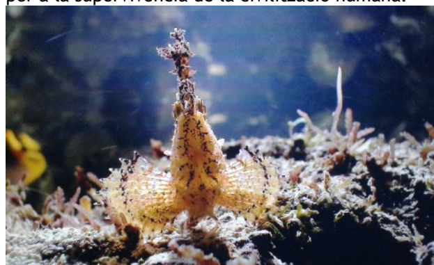
Diversitat de formes de vida al fons marí

Una idea important que es transmet és la importància i necessitat de conèixer, estimar i protegir els oceans i mars, amb la bellesa dels seus ecosistemes i diversitat de formes de vida, des dels coralls a les balenes o dofins. És necessari aquest exercici de conscienciació per poder garantir un futur per aquests ecosistemes, necessaris també per a la supervivència de la civilització humana.