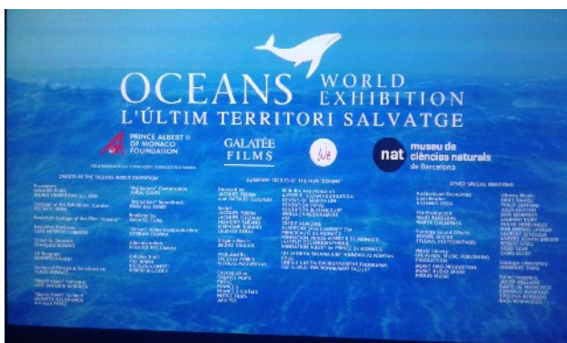
Cartell de l'exposició

Aquest és el títol de la interessantíssima exposició que el Museu de Ciències Naturals de Barcelona, ens proposa des de gener fins a setembre de 2018.