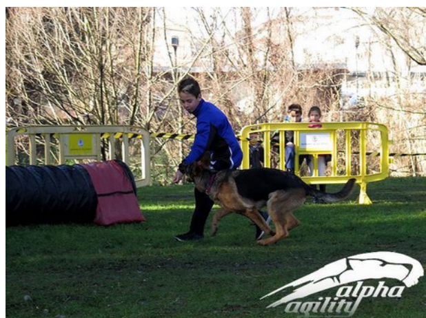
En Blacky abans d'entrar al túnel flexible