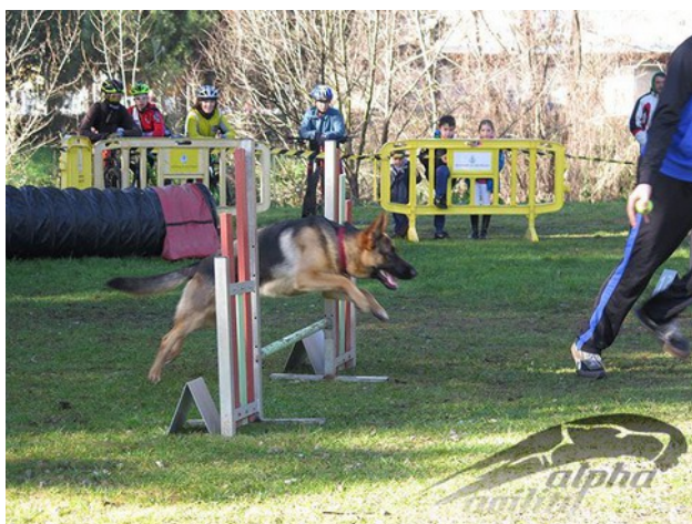
En Blacky saltant una tanca

L'agility és un esport que es practica amb gossos. Un guia dirigeix el seu gos per una sèrie d'obstacles. Per realitzar aquesta activitat cal que hi hagi un bon enteniment entre l'amo i el seu gos. Totes les races de gossos poden practicar aquest esport però la més habitual són els border collie.