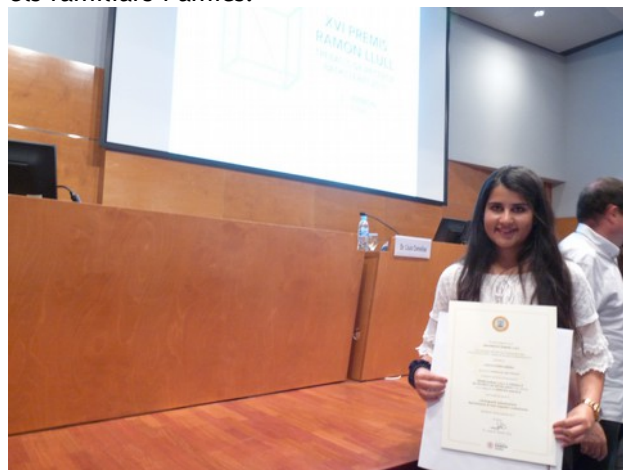
La Judith amb els diplomes dels premis

A l'acte hi van assistir a més dels diferents membres de la Universitat Ramon Llull, que van fer les presentacions, la ponència i el lliurament dels guardons, l'alumnat premiat, els tutors i tutores i els familiars i amics.