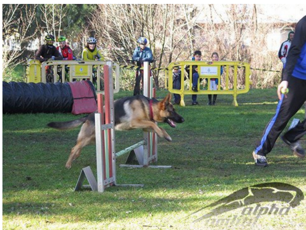
En Blacky saltant una tanca

L' agility és un esport que es practica amb gossos. Un guia dirigeix al seu gos per una sèrie d'obstacles. Calque hagi un bon enteniment entre l'amo i el seu gos.