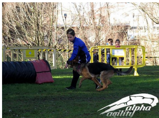
En Blacky abans d'entrar al túnel flexible