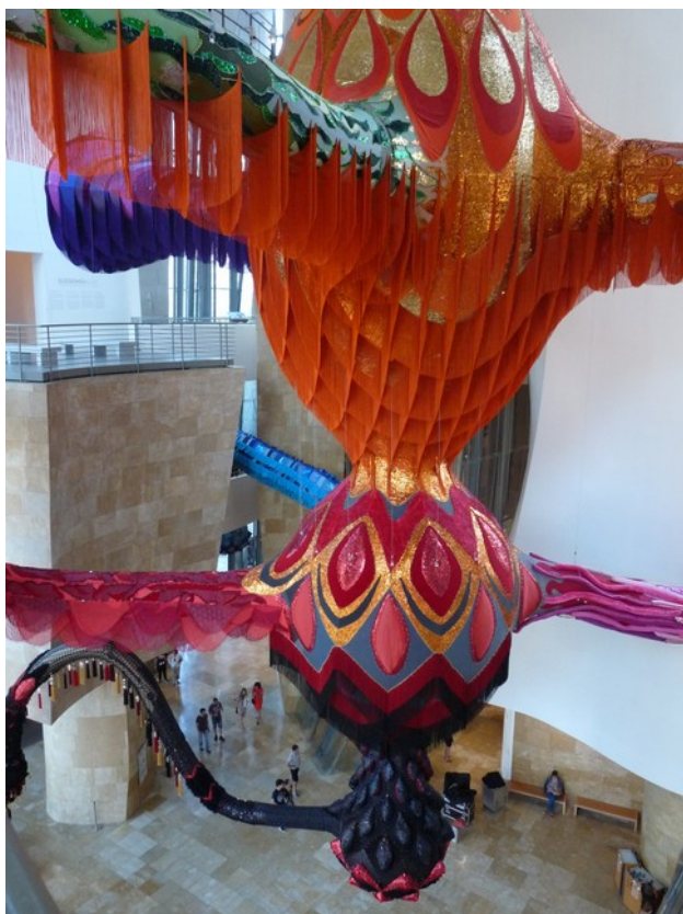
Obra gegantina de Vasconcelos a l'interior del Guggenheim de Bilbao

Les vacances són un temps de cultura i lleure, de descobrir nous llocs i persones, també noves manifestacions artístiques. Aquest estiu he descobert l'obra d'una artista fascinant: Joana Vasconcelos. També he conegut que és una artista consolidada, de gran prestigi internacional, que, des del seu taller a Lisboa realitza obres de gran sensibilitat i bellesa, amb la col·laboració d'unes cinquanta persones.